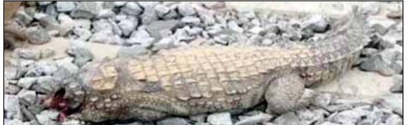
ಹಳೆ ದಾಟುವಾಗ ರೈಲಿನಡಿ ಸಿಲುಕಿ ಮೊಸಳೆ ಸಾವನ್ನಪ್ಪಿದ ಘಟನೆ ಗದಗ ಜಿಲ್ಲೆಯ ರೋಣ ತಾಲೂಕಿನ ಹೊಳೆಲೂರು ಗ್ರಾಮದ ಬಳಿ ಜರುಗಿದೆ.