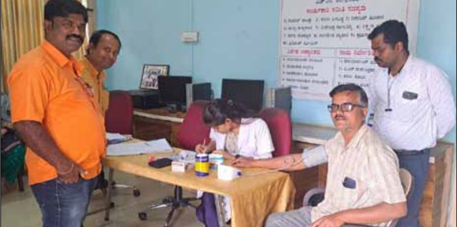
ಪತ್ರಕರ್ತರ ಕುಟುಂಬ ಸದಸ್ಯರು, ಪತ್ರಿಕಾ ವಿತರಕರು ಭಾಗಿ