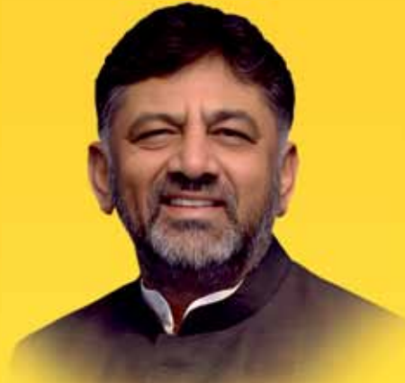
ಶ್ರೀ ಡಿ. ಕೆ. ಶಿವಕುಮಾರ್ ಮಾನ್ಯ ಉಪಮುಖ್ಯಮಂತ್ರಿಗಳು