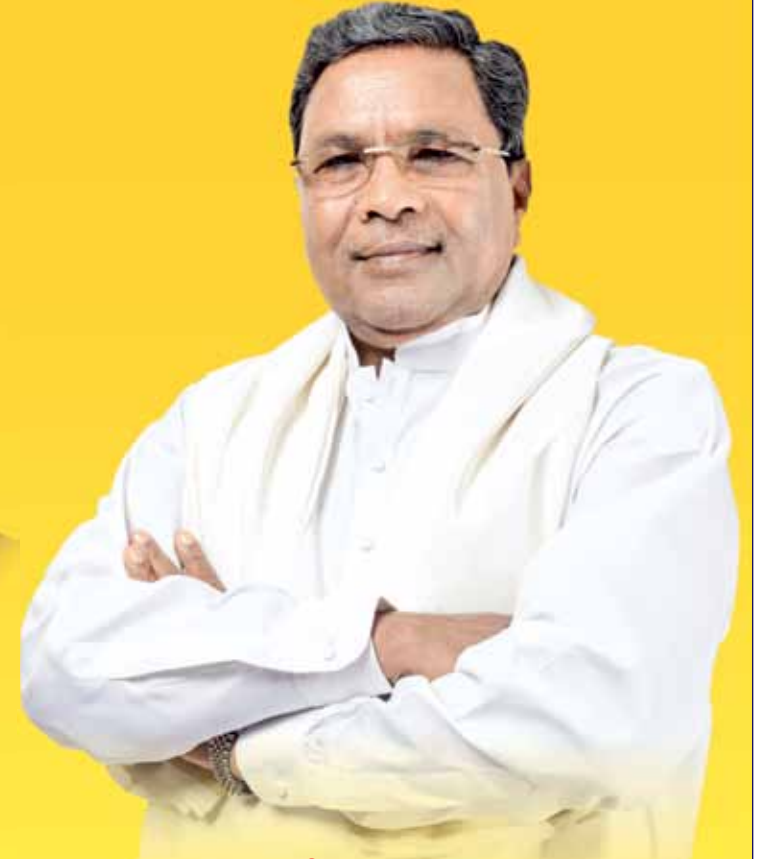
ಶ್ರೀ ಸಿದ್ದರಾಮಯ್ಯ ಸರ್ಕಾರದ ಮುಖ್ಯಮಂತ್ರಿಗಳು