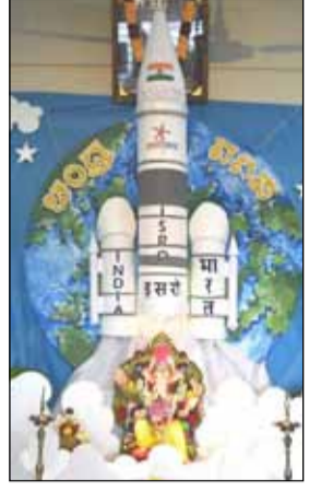
■ ವಿಜಯಸಾಕ್ಷಿ ಸುದ್ದಿ, ಗದಗ ನಗರದ ಸಂಭಾವನಾರಂಭದಲ್ಲಿರುವ ಬಾಲವಿನಾಯಕ ವಿಧಾನೀಕೇತನ ಶಿಕ್ಷಣ ಸಂಸ್ಥೆಯಲ್ಲಿ