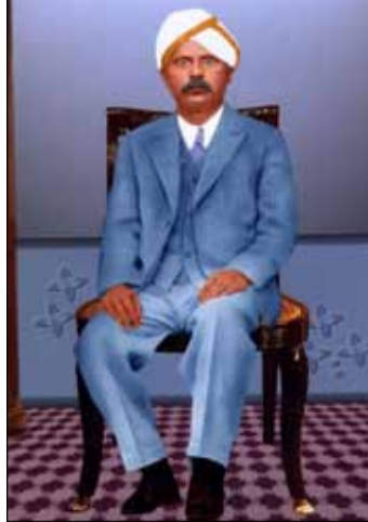
ಸಾಧ್ಯವಾಗದೆ ಇರುವುದು ನನಗೆ ಅತೀವ ನೋವನ್ನುಂಟು ಮಾಡಿದೆ. ದೈಹಿಕವಾಗಿ ನಾನು ದೆಹಲಿಯಲ್ಲಿದ್ದರೂ, ಕಾರ್ಯಕ್ರಮದಲ್ಲಿ ಸಂಘಟಕರೊಡನೆ