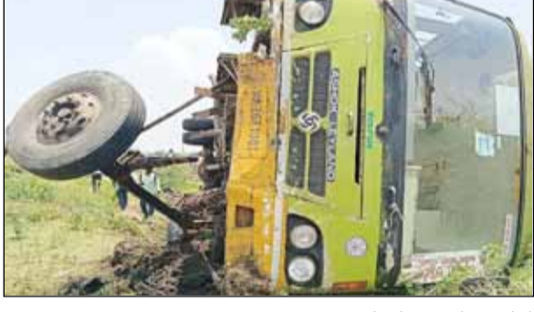
ಮಾರ್ಗಮಧ್ಯ ನಿಡಗುಂದಿ ಗ್ರಾಮದ ಬಳಿ ಬಸ್ ಮುಂದಿನ ಭಾಗ

■ ವಿಜಯಸಾಕ್ಷಿ ಸುದ್ದಿ, ರೋಣ 35 ಪ್ರಯಾಣಿಕರನ್ನು ಹೊತ್ತು ಗಜೇಂದ್ರಗಡದಿಂದ ಅರಸೀಕೆರೆಗೆ ಹೊರಟಿದ್ದ ಗಜೇಂದ್ರಗಡ ಘಟಕದ ಬಸ್ ನಿಡಗುಂದಿ ಗ್ರಾಮದ ಬಳಿ ಶುಕ್ರವಾರ ಪಲ್ಟಿಯಾಗಿದೆ. ಸಣ್ಣಮಟ್ಟದ ಗಾಯಗಳನ್ನು ಹೊರತುಪಡಿಸಿ ಪ್ರಯಾಣಿಕರಲ್ಲೂ ಪ್ರಾಣಾಪಾಯದಿಂದ ಪಾರಾಗಿದ್ದಾರೆ. ಗಜೇಂದ್ರಗಡ ಸಾಲಿಗೆ ಘಟಕಕ್ಕೆ ಸೇರಿದ್ದ ಬಸ್ ಗದಗ ಮಾರ್ಗವಾಗಿ ಅರಸೀಕೆರೆಗೆ ಹೊರಟಿತ್ತು.