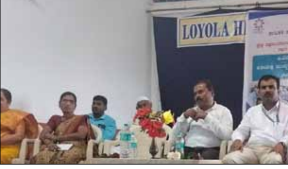
ಅಡುಗೆ ಸಿಬ್ಬಂದಿಯವರಿಗೆ ಕಾರ್ಯಾಗಾರವನ್ನು ಉದ್ಘಾಟಿಸಿ ಅಡುಗೆದಾರರು ತಾವು ತಯಾರಿಸುವ ಅಡುಗೆ ಕೋಣೆಯನ್ನು