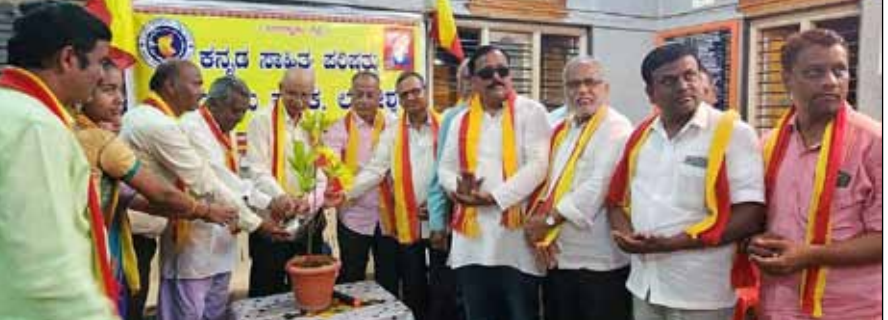
ಲಕ್ಷ್ಮೇಶ್ವರ ತಾಲೂಕಿನ ಶಿಗ್ಗಿ, ಸೂರಣಗಿ, ಬಾಲೆಹೊಸೂರು ಹಾಗೂ ಲಕ್ಷ್ಮೇಶ್ವರ ಭಾಗದ ಸ್ವಾತಂತ್ರ್ಯ ಹೋರಾಟದ ಕಿಚ್ಚು ಮಹಿಳೆಯರನ್ನೂ ಪ್ರೇರಣೆಗೊಳಪಡಿಸಿತ್ತು. ಆದರೆ ಇತಿಹಾಸದಲ್ಲಿ ಅವುಗಳಿಗೆ ಹೆಚ್ಚು ಪ್ರಾಧಾನ್ಯತೆ ಸಿಕ್ಕಿಲ್ಲ. ಇಂದಿನ ವಿದ್ಯಾರ್ಥಿಗಳು, ಯುವಕರಿಗೆ ಆ ಹೋರಾಟದ ಪರಿಚಯ ಮಾಡಿಕೊಡುವ ಸಣ್ಣ ಪ್ರಯತ್ನವೇ ಇಂದಿನ ವಿಚಾರ ಸಂಕಿರಣ.