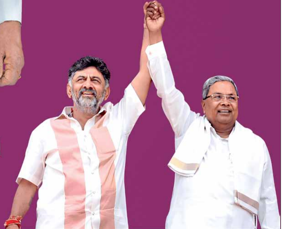
ಶ್ರೀ ಸಿದ್ದರಾಮಯ್ಯ ಸನ್ಮಾನ್ಯ ಮುಖ್ಯಮಂತ್ರಿಗಳು