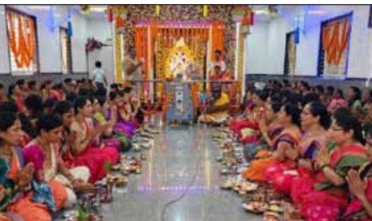
ಲಕ್ಷ್ಮೀಶ್ವರದ ಶ್ರೀ ಅಂಭಾ ಭವಾನಿ ದೇವಸ್ಥಾನದಲ್ಲಿ ಅಧಿಕ ಶ್ರಾವಣ ಶುಕ್ರವಾರದ ನಿಮಿತ್ತ ದೇವಿ ಮೂರ್ತಿಗೆ ವಿಶೇಷ ಹೂವಿನ ಅಲಂಕಾರ ನೆರವೇರಿಸಿ, 101 ಮುತ್ತುದ್ರೆಯಿಗಿ ಉಡಿ ತುಂಬುವ, ಕುಂಕುಮಾರ್ಚನ ಸಮಾಜ ನೆರವೇರಿಸಲಾಯಿತು.