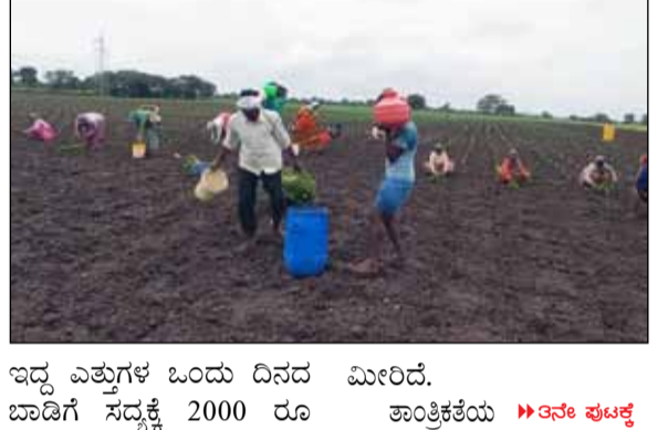
ಇದ್ದ ಎತ್ತುಗಳ ಒಂದು ದಿನದ ಮೀರಿದೆ. ಬಾಡಿಗೆ ಸದ್ಯಕ್ಕೆ 2000 ರೂ ತಾಂತ್ರಿಕತೆಯು >>> ಇನ್ನೇ ಫುಟ್