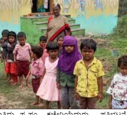
ಹಿಂದೇಟು ಹಾಕುತ್ತಿದ್ದು, ಪ ಪಂ ಕಚೇರಿಯಿದ್ದು ಪ್ರತಿಭಟನೆ ಅಧಿಕಾರಿಗಳು ಈ ರಸ್ತೆಯನ್ನು ನಡೆಸುವುದಾಗಿ ಸಾರ್ವಜನಿಕರು ತಿಳಿಸಿದ್ದಾರೆ.

■ ವಿಜಯಸಾಕ್ಷಿ ಸುದ್ದಿ, ಮುಳಬಂದ ಸತತವಾಗಿ ಸುರಿಯುತ್ತಿರುವ ಜಿಜಿ ಜಿಜಿ ಮಳೆಯಿಂದ ರಸ್ತೆಗಳು ಕೆಸರು ಗದ್ದೆಗಳಂತಾಗಿದ್ದು, ಅಂಗನವಾಡಿ ಮಕ್ಕಳು ಶಾಲೆಗೆ ತೆರಳಲು ಹಿಂದೇಟು ಹಾಕುವಂತಾಗಿದೆ. ಪಟ್ಟಣದ ಚಿಂದಿಪೇಟೆ ಓಣಿಯಲ್ಲಿ ಹೊಸದಾಗಿ ಪ್ರಾರಂಭವಾಗಿರುವ ಅಂಗನವಾಡಿಗೆ ಸಂಪರ್ಕ ರಸ್ತೆ ಇಲ್ಲದೇ ಮಕ್ಕಳು ನಿಶ್ಚಯ ಪರದಾಟವಂತಾಗಿದೆ. ಪಾಲಕರೂ ಸೇರಿದಂತೆ ಮಕ್ಕಳು ಕೆಸರು ರಸ್ತೆಯಲ್ಲಿ ನಿತ್ಯವೂ ಬೀಳುತ್ತಿದ್ದು, ಸಾಂಕ್ರಾಮಿಕ ರೋಗಗಳ ಭಯವೂ ಕಾಡುತ್ತಿದೆ. ಇದರಿಂದ ಪಾಲಕರು ಮಕ್ಕಳನ್ನು ಅಂಗನವಾಡಿಗೆ ಕಳಿಸಲು