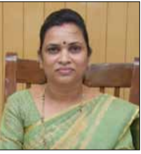
ಅಪರ ಜಿಲ್ಲಾಧಿಕಾರಿಯಾಗಿ ಕಾರ್ಯನಿರ್ವಹಿಸಿದ್ದಾರೆ.