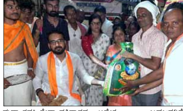
ಮಹಾತಪಸ್ವಿ ಸೇವಾ ಪ್ರತಿಷ್ಠಾನದ ವತಿಯಿಂದ 'ಅನ್ನವೃದ್ಧಿ-ಬದುಕಿನ ಸಮೃದ್ಧಿ' ಅಭಿಯಾನದ ಅಡಿಯಲ್ಲಿ 'ಸೇವೆಗೈದ ಕೈಗಳಿಗೆ ಸತ್ಕಾರದ ಸಂಭ್ರಮ' ಎಂಬ ಕಾರ್ಯಕ್ರಮದ ಸಾನ್ನಿಧ್ಯ ವಹಿಸಿ ಅಶೀರ್ವಚನ ನೀಡಿ ಮಾತನಾಡಿದರು. ಅನ್ನವೃದ್ಧಿಯಾದರೆ ಅವರ ಬದುಕಿನ ಸಮೃದ್ಧಿಯಾಗುತ್ತದೆ ಎನ್ನುವ ಯೋಜನೆಯಿಂದ ಈ ಅಭಿಯಾನವನ್ನು ಪ್ರಾರಂಭಿಸಿದ್ದು,