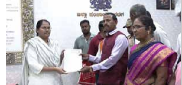
ಗ್ರಾಮ ಪಂಚಾಯತ್ ಅಧ್ಯಕ್ಷರು, ಗ್ರಾಮದ ಮುಖ್ಯ ಹೆದ್ದಾರಿಗೆ ಸದಸ್ಯರು ಸೇರಿಕೊಂಡು ಹೊಂದಿಕೊಂಡಿರುವ ಸರ್ಕಾರಿ ಗೌರವಗಳೊಂದಿಗೆ ಕೋಟುಮಚಗಿ