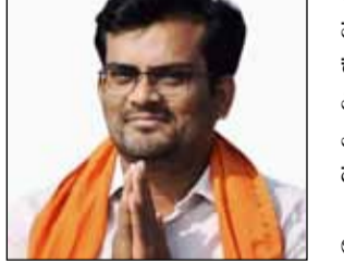
■ ವಿಜಯಸಾಕ್ಷಿ ಸುದ್ದಿ, ಶಿರಹಟ್ಟಿ ಮುಖ್ಯಮಂತ್ರಿ ಸಿದ್ದರಾಮಯ್ಯ ಅವರು ಶುಕ್ರವಾರ ಮಂಡಿಸಿದ ಬಜೆಟ್‌ನಲ್ಲಿ ನನ್ನ ಮತಕ್ಷೇತ್ರ ವ್ಯಾಪ್ತಿಯಲ್ಲಿ ಪ್ರವಾಸೋದ್ಯಮ ಇಲಾಖೆ ವತಿಯಿಂದ ಐದೇನಿ ವಲಸೆ ಪಕ್ಷಿಗಳ ತಾಣವಾದ ಮಾಗಡಿ ಕೆರೆ ಹಾಗೂ ಕಪ್ಪತ್ತೂಡವನ್ನು ಪ್ರವಾಸಿ