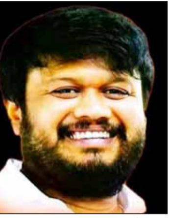
ಕಳಸಾ-ಬಂಡೂರಿ ನಾಲಾ ತಿರುವು ಯೋಜನೆ ಕಾಮಗಾರಿಗಾಗಿ ಸುಮಾರು 1,500 ಕೋಟಿ ರೂ. ಮೀಸಲಿಡಲಾಗಿತ್ತು. ಇದೀಗ ಕಾಂಗ್ರೆಸ್ ಸರ್ಕಾರವು ಒಂದು ಸಾವಿರ ಕೋಟಿ ರೂ. ಅನುದಾನ ಮೀಸಲಿಟ್ಟಿದ್ದು, ಶೀಘ್ರವೇ ಕಾಮಗಾರಿ ಆರಂಭಿಸಿ ಈ ಭಾಗದ ರೈತರಿಗೆ ಅನುಕೂಲ ಮಾಡಿಕೊಡಬೇಕು. >>> ಡಾ. ಪುಟ್ಟ

■ ವಿಜಯಸಾಕ್ಷಿ ಸುದ್ದಿ, ಗದಗ ಕೈಗಾರಿಕೆ ಸ್ಥಾಪನೆ, ಕೃಷಿ, ನೀರಾವರಿ ಸೇರಿದಂತೆ ಕೆಲ ಕ್ಷೇತ್ರಗಳ ಸಮಗ್ರ ಅಭಿವೃದ್ಧಿಯ ಮೇಲಿನ ಜಿಲ್ಲೆಯ ಜನರ ದಶಕಗಳ ನಿರೀಕ್ಷೆಯನ್ನು ರಾಜ್ಯ ಸರ್ಕಾರದ 2023-24ನೇ ಸಾಲಿನ ಬಜೆಟ್ ಹುಸಿಯಾಗಿಸಿದೆ ಎಂದು ಬಿಜೆಪಿ ಯುವ ನಾಯಕ ಅನಿಲ್ ಮೋಸಿಕಾಯಿ ಅಭಿಪ್ರಾಯಪಟ್ಟಿದ್ದಾರೆ. ಈ ಹಿಂದಿನ ಬಿಜೆಪಿ ಸರ್ಕಾರ 55 ಕಿ.ಮೀ ಉದ್ದದ ಗದಗ-ಯಲವಗಿ ನೂತನ ರೈಲು ಮಾರ್ಗ ಯೋಜನೆಯನ್ನು 640 ಕೋಟಿ ರೂ.ಗಳ ಅಂದಾಜು ವೆಚ್ಚದಲ್ಲಿ ರಾಜ್ಯ ಸರ್ಕಾರದ ವತಿಯಿಂದ ಭೂಸ್ವಾಧೀನ ವೆಚ್ಚವನ್ನು ಕೇಂದ್ರದ ಸಹಭಾಗಿತ್ವದೊಂದಿಗೆ ಜಾರಿಗೊಳಿಸಲು ಕೇಂದ್ರ ಸರ್ಕಾರಕ್ಕೆ ಪ್ರಸ್ತಾವನೆ ಸಲ್ಲಿಸುವ ಬಗ್ಗೆ ಘೋಷಿಸಿತ್ತು. ಈ ಬಗ್ಗೆ ಪ್ರಸಕ್ತ ಸಾಲಿನ ಬಜೆಟ್‌ನಲ್ಲಿ ಪುನಃ ಪ್ರಸ್ತಾಪಿಸಿದ್ದು, ರಾಜ್ಯ ಸರ್ಕಾರ ಶೀಘ್ರವೇ ಕೇಂದ್ರ ಸರ್ಕಾರಕ್ಕೆ ಪ್ರಸ್ತಾವನೆ ಸಲ್ಲಿಸಬೇಕು. ಬಿಜೆಪಿ ಸರ್ಕಾರದ ಅವಧಿಯಲ್ಲಿ