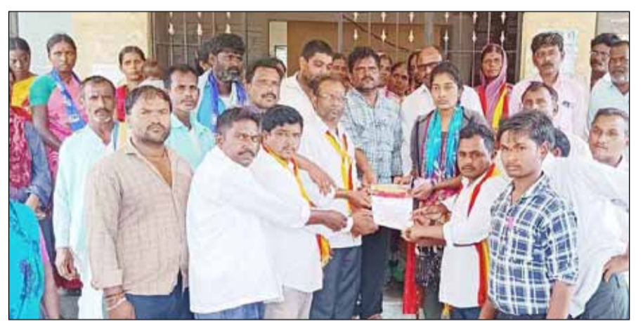
■ವಿಜಯಸಾಕ್ಷಿ ಸುದ್ದಿ, ರೋಣ ತಾಲೂಕಾ ಕೇಂದ್ರದಲ್ಲಿ ಕಟ್ಟಡ ಕಾರ್ಮಿಕರು ಸಭೆ ಸಮಾರಂಭಗಳನ್ನು ನಡೆಸಲು ಕಲ್ಯಾಣ ಭವನ ಅಥವಾ ಸಮುದಾಯ ಭವನವನ್ನು ನಿರ್ಮಿಸಬೇಕು

ಕಲ್ಯಾಣ ಭವನ ಅಥವಾ ಸಮುದಾಯ ಭವನವನ್ನು ನಿರ್ಮಿಸಬೇಕು ಹಾಗೂ ಅಸಂಘಟಿತ ಕಾರ್ಮಿಕರಿಗೆ ಮೂಲಭೂತ ಸೌಲಭ್ಯಗಳನ್ನು ಒದಗಿಸಲು ಅಗತ್ಯ ಕ್ರಮ